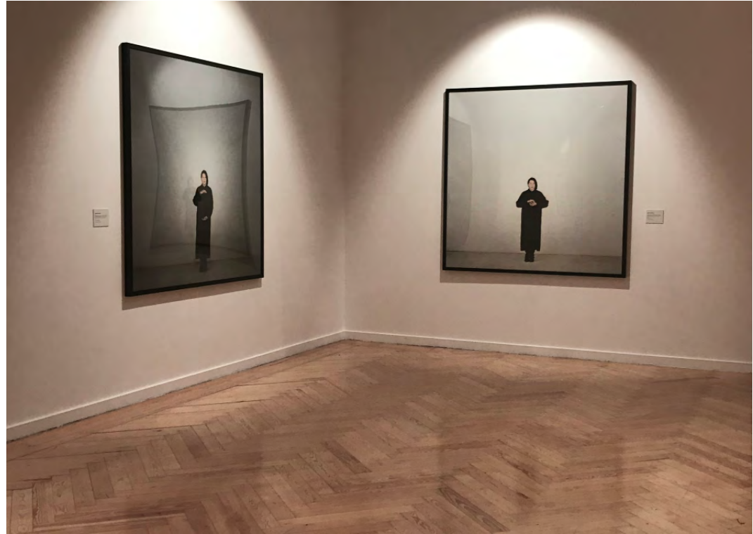
Vanitas . Marina Abramović. PhotoEspaña 2023. Círculo de Bellas Artes. Madrid.