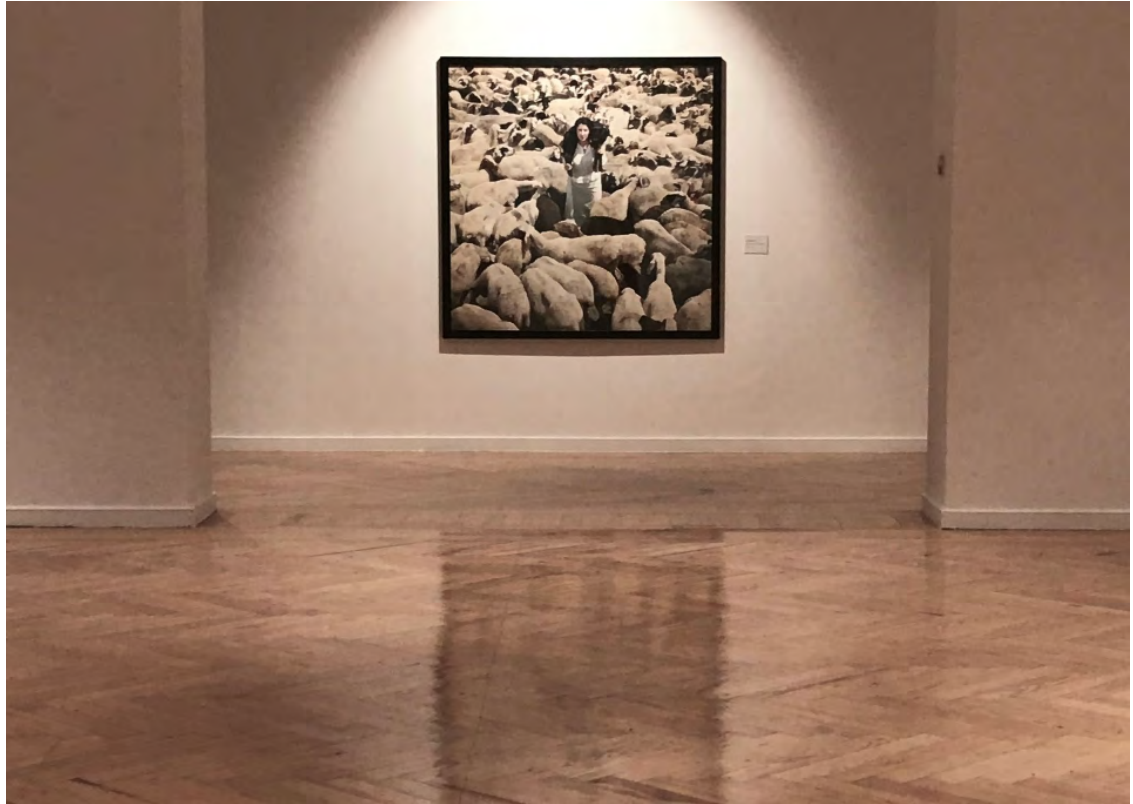
Vanitas . Marina Abramović. PhotoEspaña 2023. Círculo de Bellas Artes. Madrid.