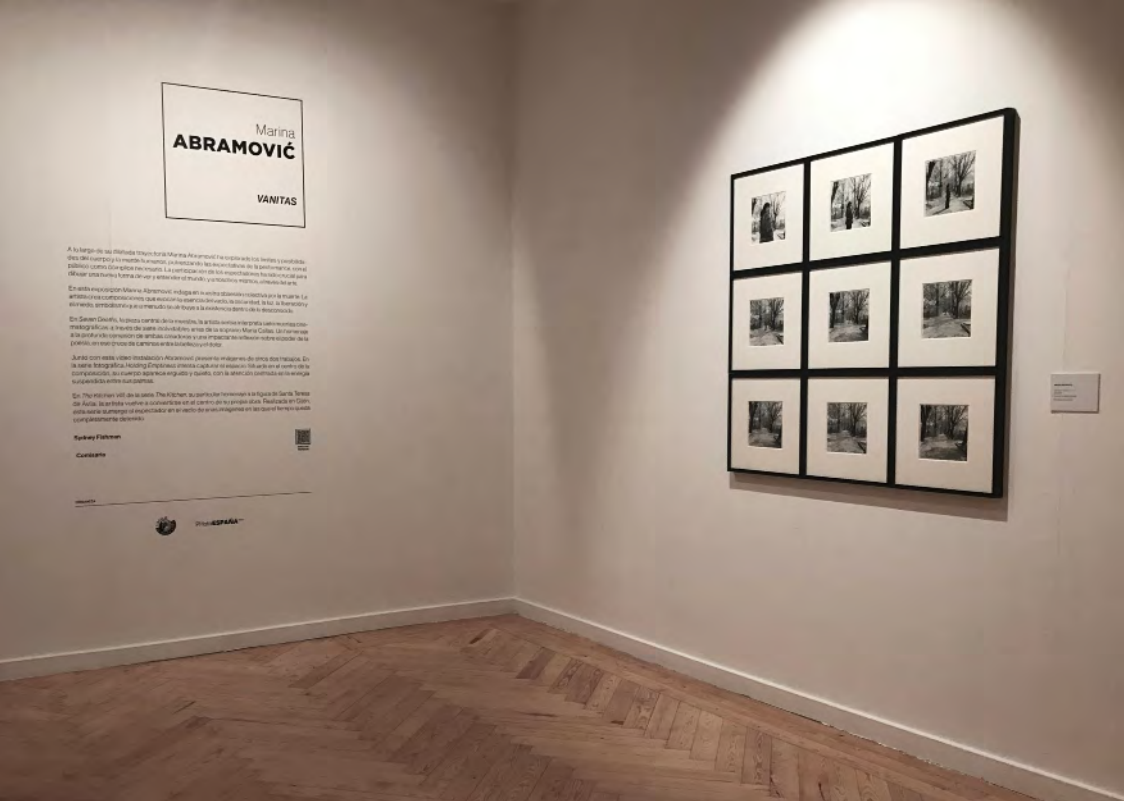
Vanitas. Marina Abramović. PhotoEspaña 2023. Círculo de Bellas Artes. Madrid.