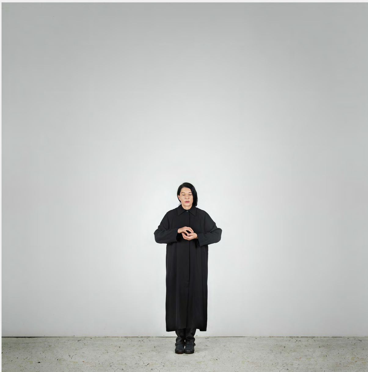
HOLDING EMPTINESS (C), 2012 from the series WITH EYES CLOSED I SEE HAPPINESS

FINE ART PIGMENT PRINT 160 x 160 cm 7 + 2 AP, ED. 7