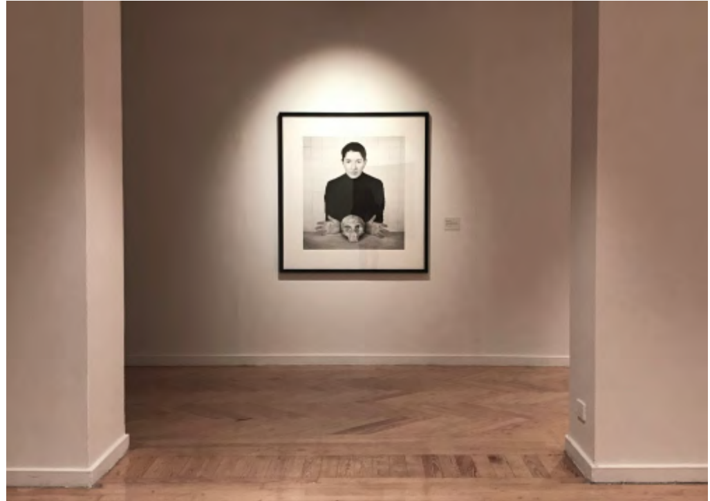
Vanitas . Marina Abramović. PhotoEspaña 2023. Círculo de Bellas Artes. Madrid.