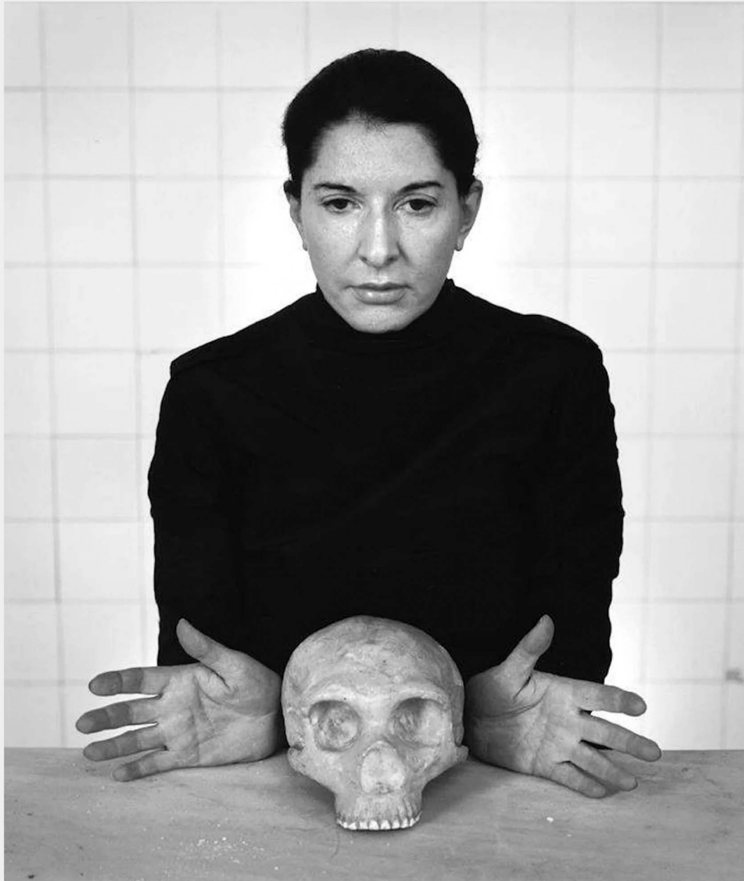
THE KITCHEN VIII, 2009 from the series THE KITCHEN, HOMAGE TO ST. THERESE

CHROMOGENIC PRINT 141 x 131 cm 9 + 2 AP, ED. 1