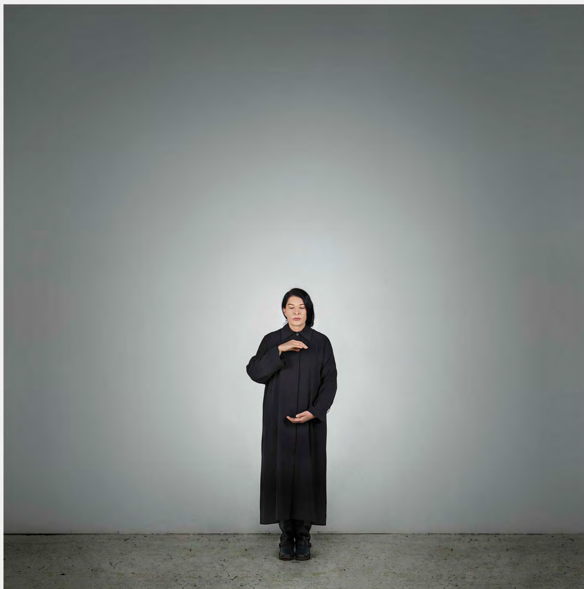
HOLDING EMPTINESS (A), 2012 from the series WITH EYES CLOSED I SEE HAPPINESS

FINE ART PIGMENT PRINT 160 x 160 cm 7 + 2 AP, ED. 7